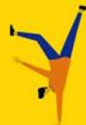
variatie in je bezigheden