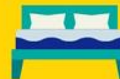
op tijd naar bed